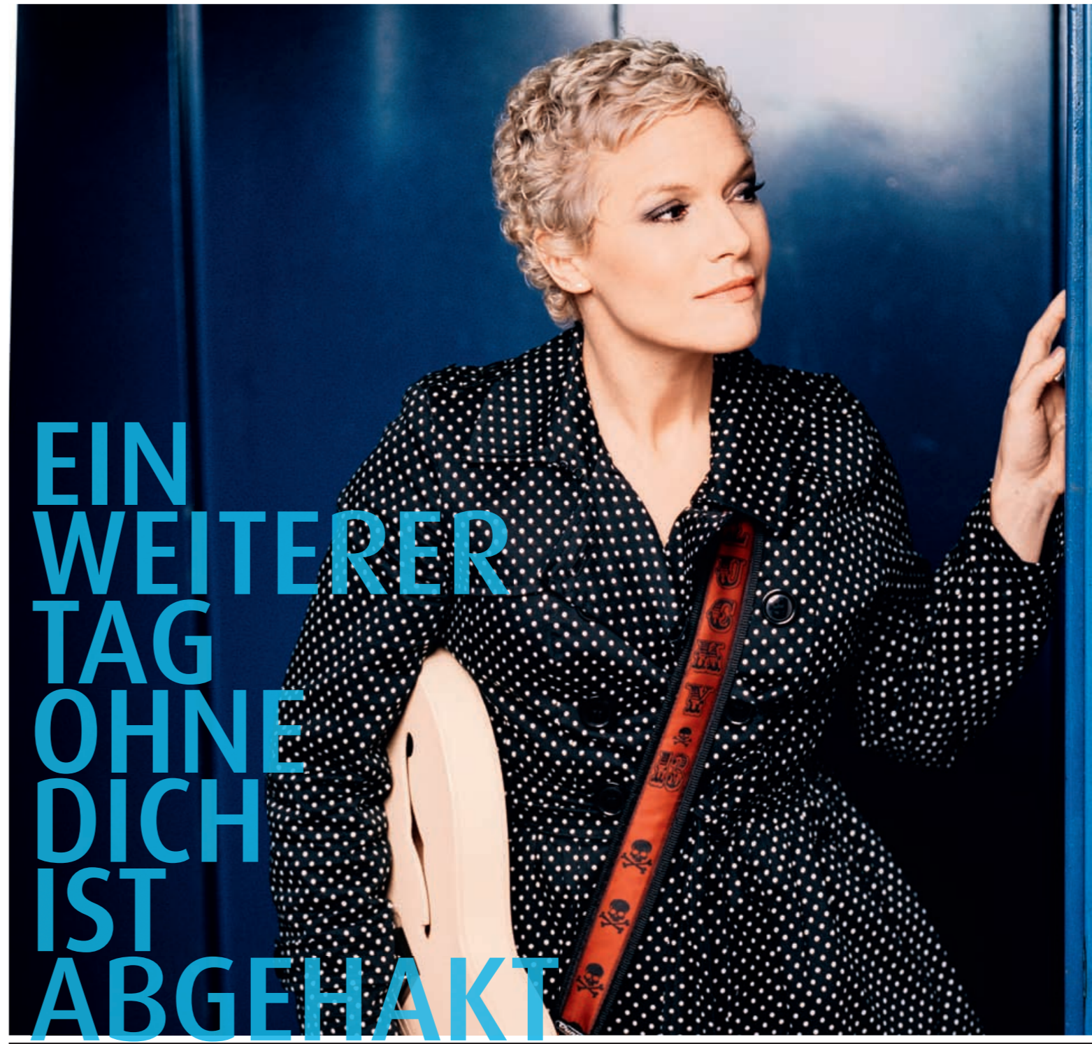
SONG # 04: „Fast drüber weg“

Tickets gibt es über www.eventim.de sowie unter der Tickethotline 01805-663661 (0,14 €/Min)